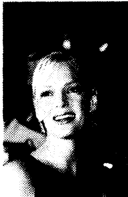
Da sinistra: Uma Thurman, Nicole Kidman e JK Rowlings. Sotto: una miss digitale. A destra: il bestseller di Cruise, guru del fitness

misurati non solo al livello di vita matrimoniale, ma anche sui prevedibili, futuri guadagni del marito. A conferma della ricerca gli esempi si sprecano: dalla "mamma" di Harry Potter, JK Rowlings, che ha cominciato a scrivere, neonato in braccio, dopo una separazione. A Nicole Kidman: apprezzata sempre. Ma vera diva dopo il divorzio da Tom Cruise.